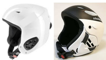
Beispiele: Helm mit Vollschale und Höröffnung